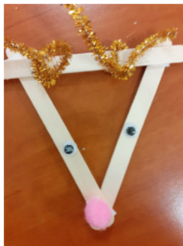
Il. 11. Praca plastyczna. Monika P., Renifer