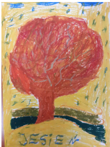
Il. 6. Praca plastyczna. Natalia M., Jesień