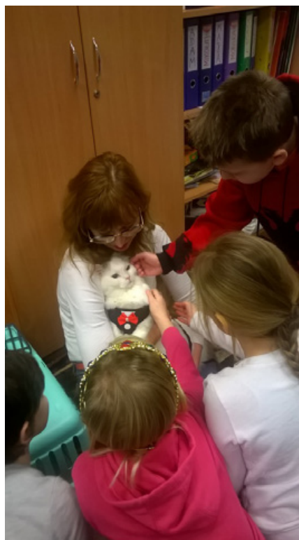
Il. 12. Terapia z kotem