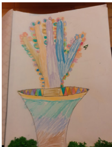
Il. 7. Praca plastyczna. Laura Sz., Strażnik przyrody