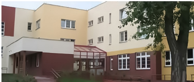
Il. 2. Budynek szkoły