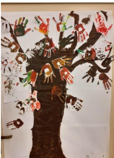
Il. 8. Praca plastyczna. Klasy 1, 2 i 3 SP, Powitanie jesieni