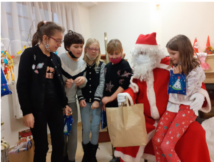
Il. 14. Spotkanie z Mikołajem