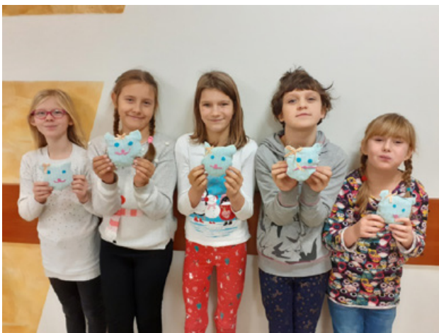
Il. 9. Prace plastyczne. Uczennice klasy 3, Tańczyła igła z nitką