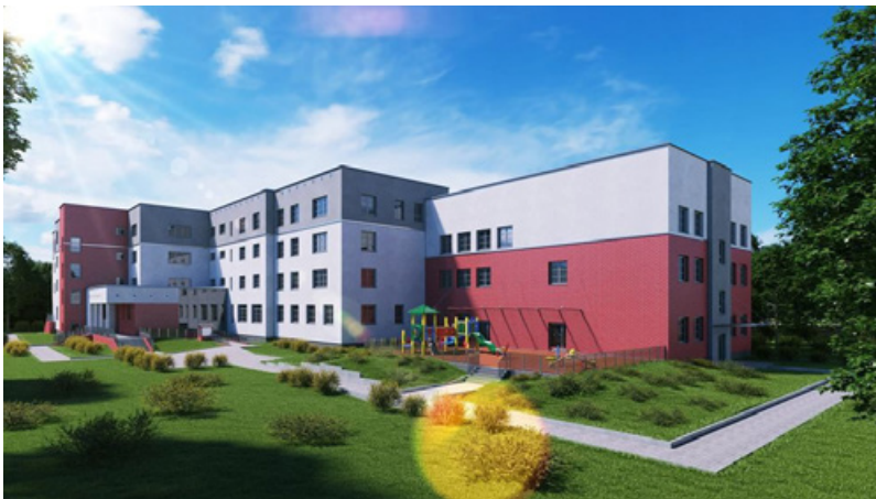
Il. 3. Nowa inwestycja