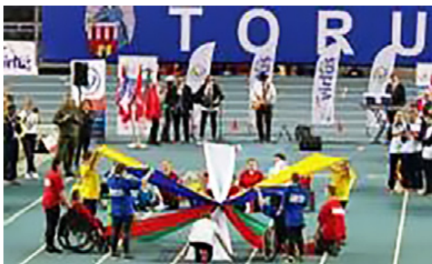
Il. 14. Występ na Halowych Mistrzostwach Świata

Niezwykle ważnym wyróżnieniem dla Kujawsko-Pomorskiego Specjalnego Ośrodka Szkolno-Wychowawczego było zaproszenie do otwarcia Halowych Mistrzostw Świata w lekkiej atletyce osób z niepełnosprawnością intelektualną, które rozpoczęły się 25 lutego 2020 r. w Arenie Toruń, a zakończyły się 27 lutego 2020 r. Do występu inauguracyjnego Mistrzostwa Prezes