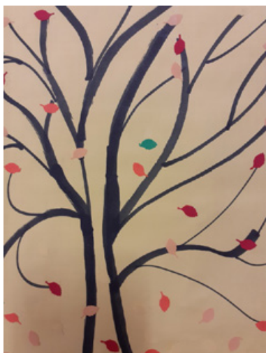
Il. 10. Praca plastyczna. Kamil K., Jesienne kolory